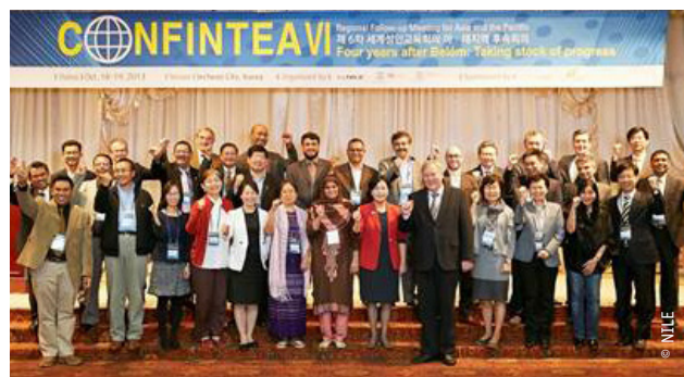
Participantes de la reunión de seguimiento de CONFINTEA VI para Asia y el Pacífico

Al final de la reunión, una visita de campo a la Exposición Nacional sobre Educación a lo Largo de Toda la Vida, que atrajo a más de 370.000 visitantes con el objetivo de promover una cultura vibrante de aprendizaje en la población, reforzó la importancia de la educación de adultos como parte de una perspectiva de aprendizaje a lo largo de toda la vida.