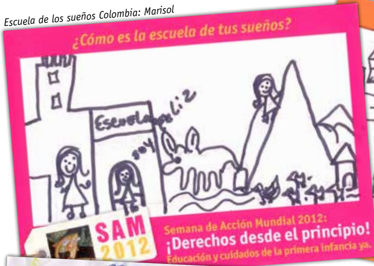
Escuela de los sueños Colombia: Marisol