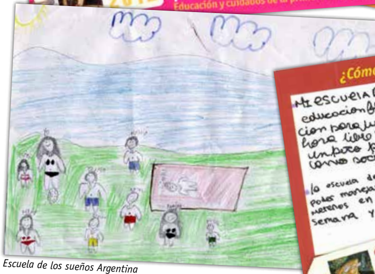
Escuela de los sueños Argentina